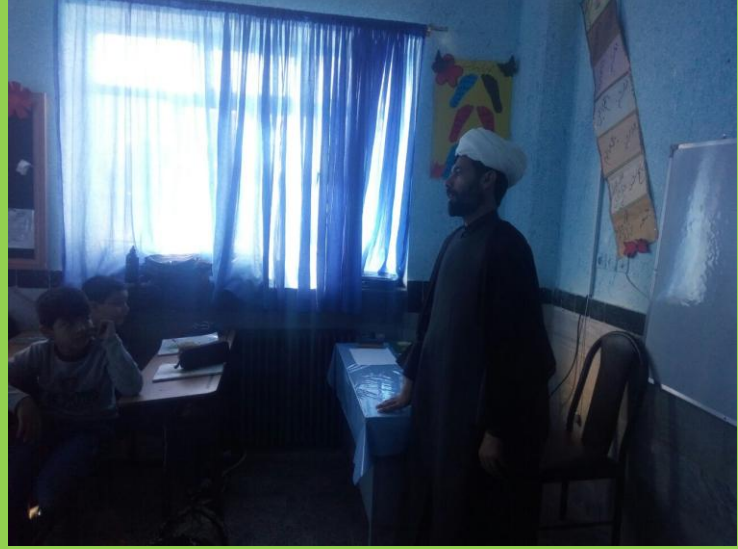
نماز و سخنرانی