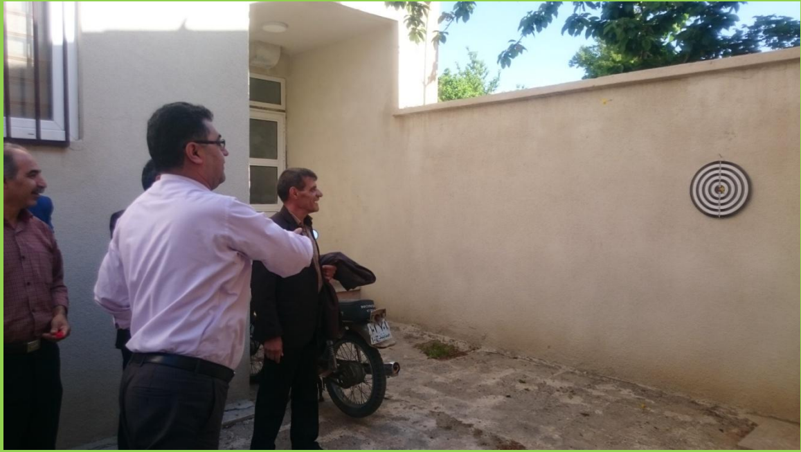
جلسات شورای فرهنگی