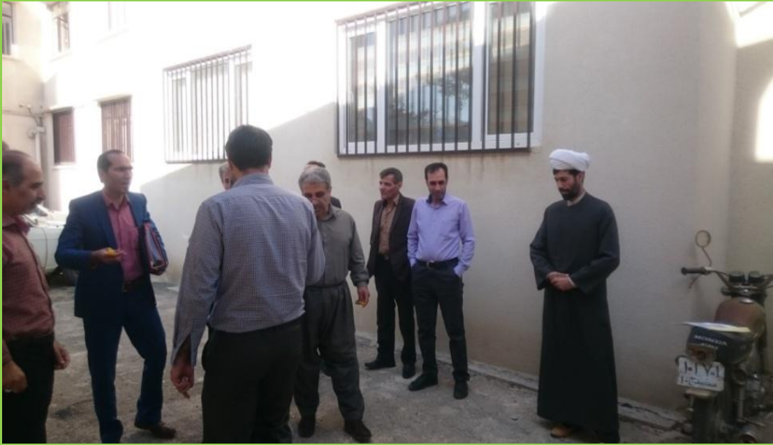
حضور رئیس اداره عقیدتی سازمان جهاد کشاورزی استان کردستان در جمع همکاران به هنگام نماز جماعت